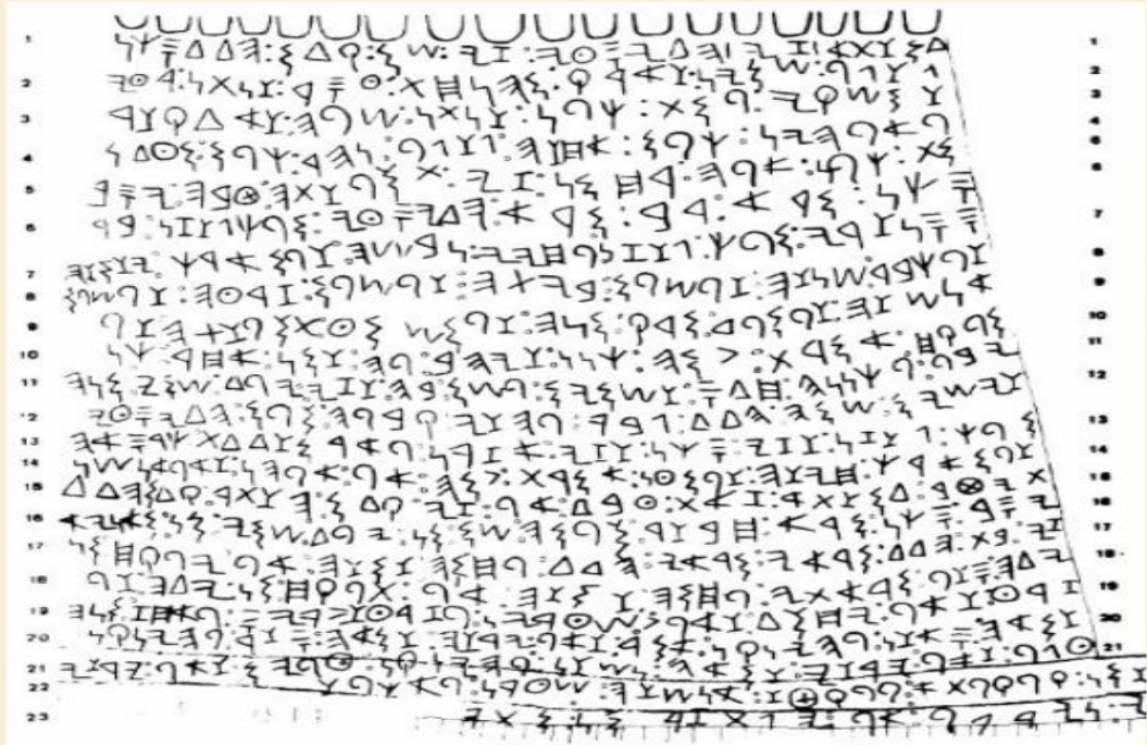
الشكل 2. 2. 1: نقش تل الفخيرية من القرن التاسع ق.م. {... Abou-Assaf: La statue de Tell Fekherye}