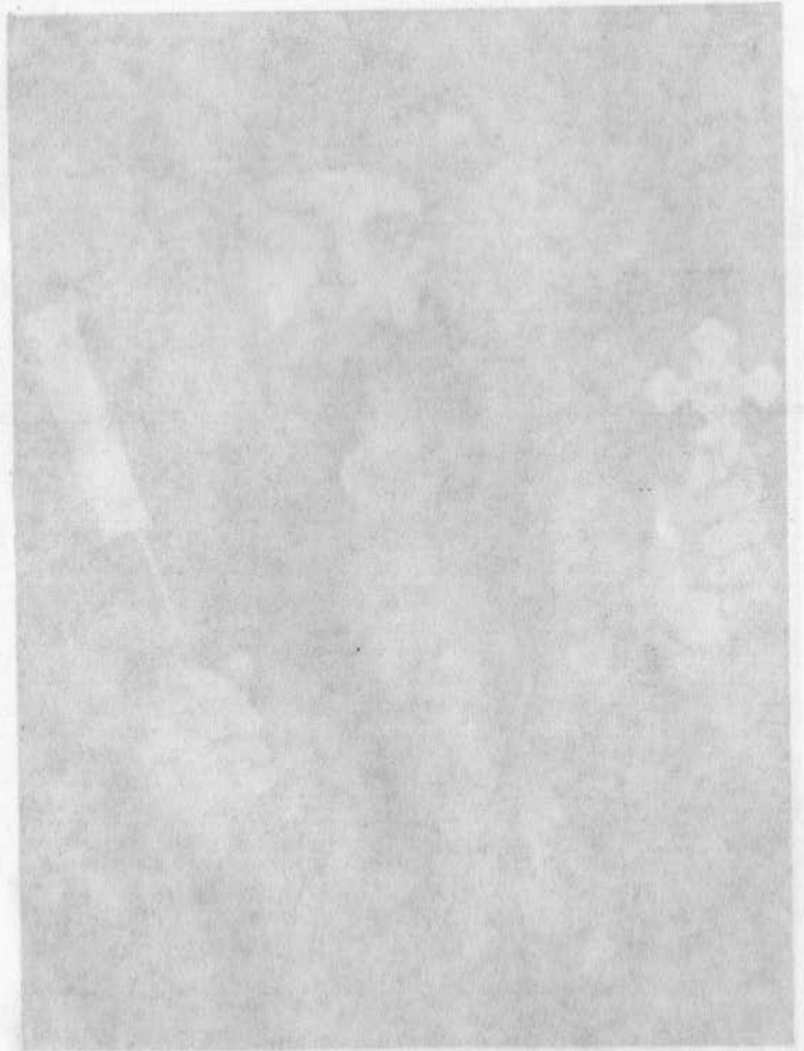
شمال القاه منهنه لولسوا قساعة كيسة هداة ان جانا نايبه باصبع قس منسى كاسكا اولي