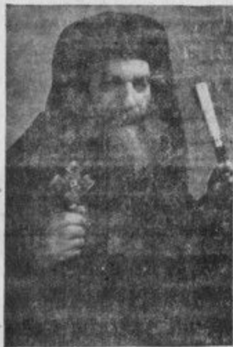
حضرة صاحب الغبطة البابا المعظم أنبا كيرلس السادس بابا وبطريك الكرازة المرقسية

« بسم الأب والابن والروح القدس اله واحد آمين »